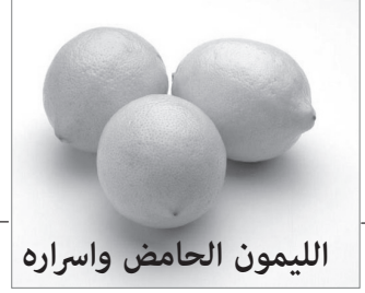
الليمون الحامض واسراره

وكذلك ثبتت فعالية الليمون في علاج السعال، والجروح البسيطة، وآلام الحلق، ولسعات الحشرات، كما انه مفيد في خفض الحرارة، وفي الوقاية ضد تكوّن حصى الكلى، وهناك المزيد من فوائد الليمون. ويمكن للوصفات التي تحتوي على عصير الليمون ان تحل محل جميع منتجات النظافة الغالية والملئمة بالكيماويات، وربما تدهشين اذا علمتي ان المستحضرات التي برائحة الليمون لا تحتوي على الليمون اطلاقا، ولكن على اضافات كيميائية.